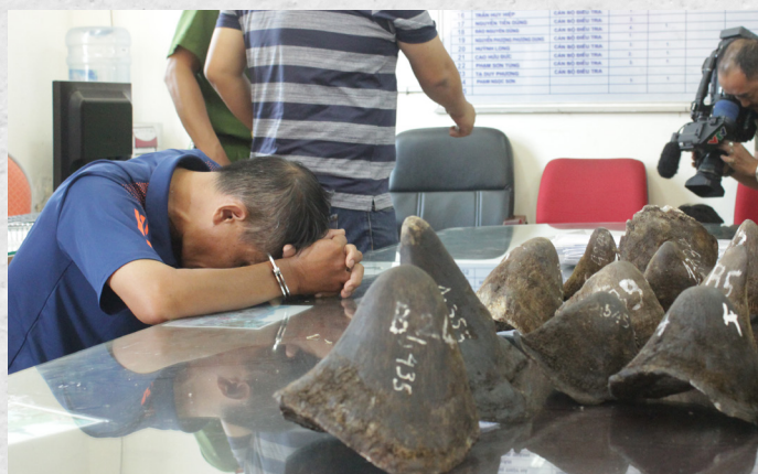
Ảnh: Một số đối tượng cùng tang vật sừng tê giác bị tịch thu

Trong giai đoạn 2017 - 2021, ENV ghi nhận các cơ quan chức năng phát hiện ít nhất 35 vụ án liên quan đến sừng tê giác tại Việt Nam, chủ yếu tại các khu vực cảng biển, cảng hàng không và biên giới đất liền. Từ những vụ án này, các cơ quan chức năng trên cả nước đã tịch thu tổng cộng 857,96 kg sừng tê giác và bắt giữ 59 đối tượng liên quan.