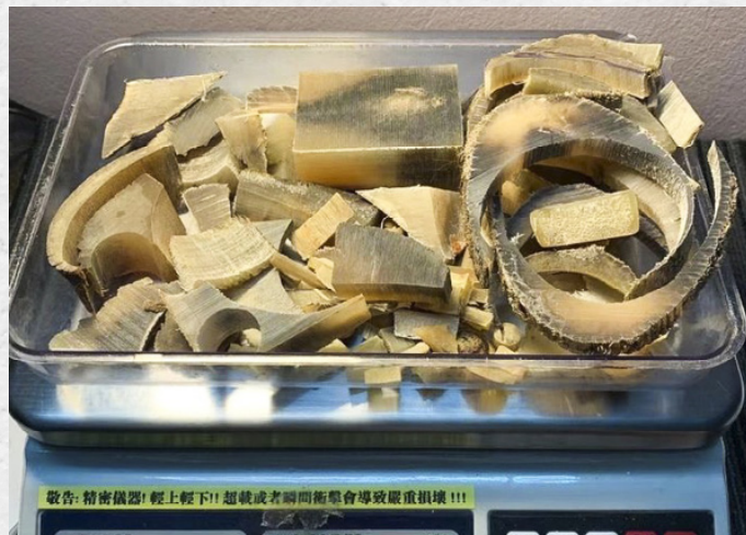
Ảnh: Nguyễn Mậu Chiến - Đối tượng được cho là cầm đầu một đường dây chuyên buôn lậu sừng tê giác và nhiều loài động vật hoang dã khác từ châu Phi về Việt Nam, đã bị bắt giữ vào năm 2017, bị khởi tố và nhận án phạt tù cho hành vi phạm tội của mình.

Theo ghi nhận của ENV, 27 đối tượng đã bị tuyên án phạt tù với mức phạt từ 10 tháng tới 14 năm trong giai đoạn 2017-2021 vì các tội liên quan đến sừng tê giác. Mức án tù trung bình áp dụng cho các đối tượng phạm tội về sừng tê giác là 6,07 năm, cao hơn mức án tù trung bình áp dụng với các đối tượng phạm tội liên quan đến các loài động vật hoang dã khác trong cùng giai đoạn (4,08 năm).