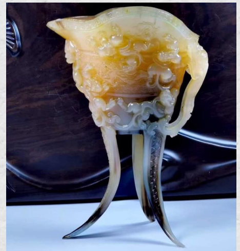
Ảnh: Chén trà, ly rượu và mặt dây chuyền chế tác từ sừng tê giác