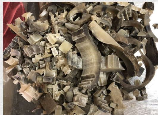
Ảnh: Đĩa mài sừng, cao sừng, và các mảnh sừng tê giác được đồn đại có tác dụng chữa bệnh.

Tương tự như ngà voi, sừng tê giác cũng được chế tác thành các sản phẩm đắt tiền như mặt dây chuyền, bộ ấm trà hay các sản phẩm trang trí chạm khắc khác. Tuy nhiên các sản phẩm này rất ít phổ biến hơn rất nhiều so với các sản phẩm từ ngà voi.