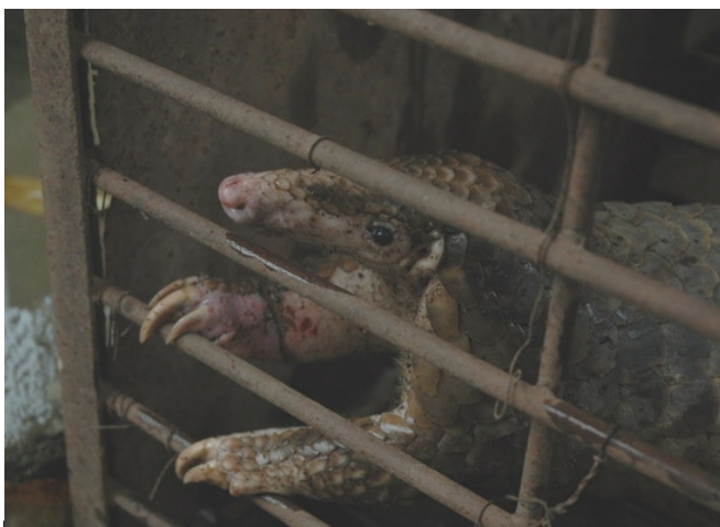
Cá thể tê tê bị tịch thu bởi chi cục kiểm lâm tỉnh Quảng Trị

Kon Tum: Một trong năm đối tượng vận chuyển 21,9 kg tê tê do hạt Kiểm lâm huyện Ngọc Hồi tịch thu tháng 8/2006 bị xử phạt 18 tháng tù giam, 4 đối tượng còn lại mỗi người lĩnh án từ 6 đến 9 tháng tù treo. (Thông tin được lưu trong hồ sơ số 285B).