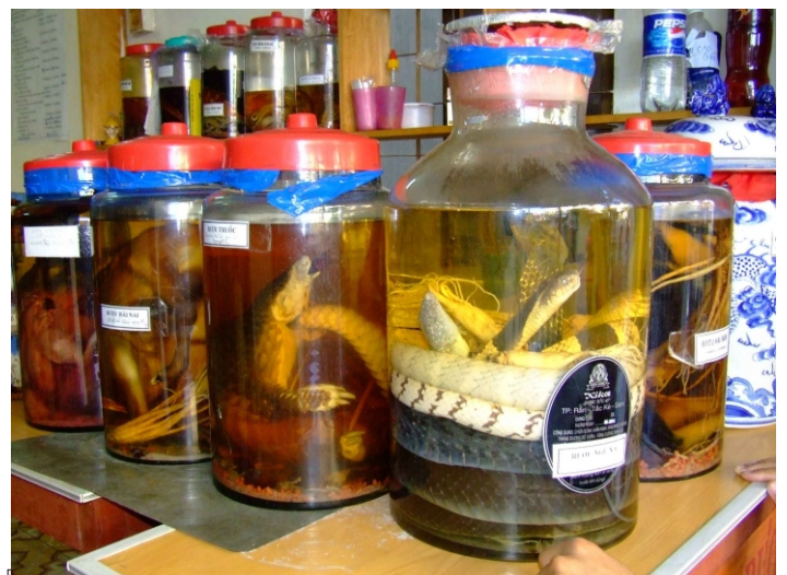
Các bình rượu ngâm tê tê và rắn

Hà Nội: Một chủ cửa hàng tình nguyện chấm dứt bày bán mật gấu và các sản phẩm ĐVHD khác sau khi ENV gửi khuyến cáo và văn bản luật thông báo về hành vi vi phạm. (Thông tin được lưu trong hồ sơ số 266B)