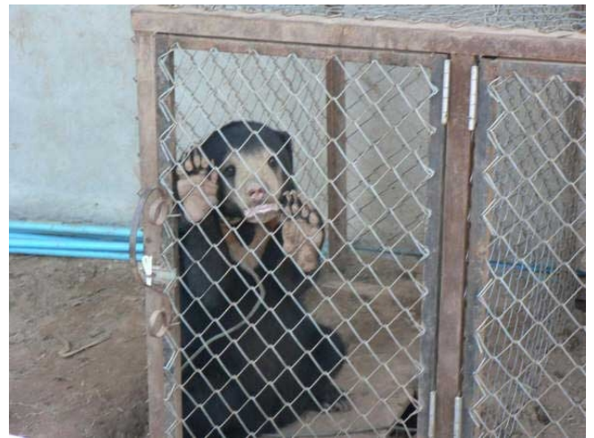
Một cá thể gấu chó bị nuôi nhốt trái phép ở Lào đang chờ được cứu hộ