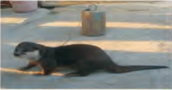
Một trong hai cá thể rái cá tịch thu từ một người dân Tp. Hồ Chí Minh khi người này đang định rao bán chúng trên mạng Internet