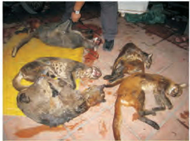
Bảy con beo lửa do cảnh sát môi trường Hà Nội tịch thu vào tháng 5. Xương của chúng thường được sử dụng làm thuốc

Ngày 21/5/2010, Phòng Cảnh sát môi trường Công an Tp. Hà Nội phát hiện và bắt giữ 6 con beo lửa đông lạnh trên một xe taxi đang đỗ ở khu vực quận Đống Đa. Ba đối tượng tình nghi đã bị bắt và khai nhận chúng đã bắt số động vật nói trên tại khu vực rừng dọc theo biên giới Việt - Lào và dự định mang về Việt Nam để nấu cao. Đây là vụ bắt giữ beo lửa với số lượng lớn nhất mà Phòng Bảo vệ Động vật hoang dã của ENV ghi