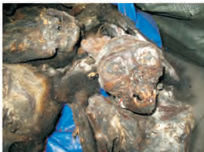
Phần xác khô của các con chà vá và chân đen tịch thu năm 2009. Xương chà vá thường bị dùng để làm thuốc trong đông y

Ngày 8/1/2010, Chi cục Kiểm lâm tỉnh Lai Châu đã tịch thu 6 cá thể khỉ theo nguồn tin báo của quần chúng vào cuối năm 2009. Sau đó số động vật này đã được cán bộ ENV chuyển giao về Trung tâm cứu hộ động vật hoang dã Sóc Sơn,