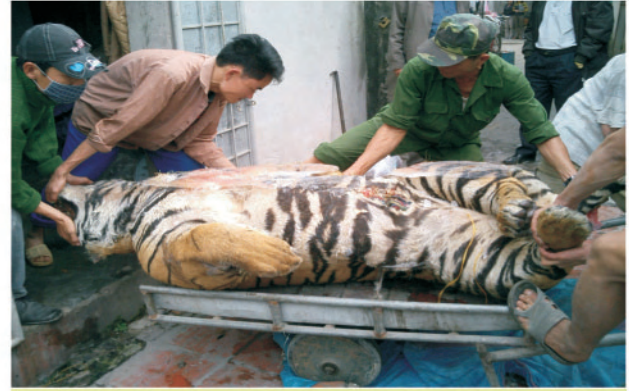
Một cá thể hổ đông lạnh bị Cảnh sát môi trường tịch thu năm 2008