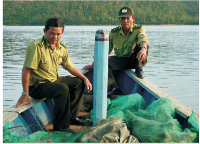
Kiểm lâm tỉnh Quảng Nam đang chuẩn bị thả rắn và các ĐVHD khác tịch thu được về tự nhiên

Nếu muốn bảo tồn các loài động vật hoang dã trong thời đại kinh tế phát triển nhanh chóng hiện nay, chúng ta phải chấm dứt sự tham gia của các cơ quan kiểm lâm trong hoạt động buôn bán động vật hoang dã. Việc bán đấu giá động vật tịch thu là không trái luật, tuy nhiên việc cho phép cán bộ kiểm lâm bán thanh lý động vật hoang dã tịch thu là đi ngược lại với mục đích bảo tồn. Để bảo vệ ĐVHD cần phải chấm dứt hoạt động bán thanh lý.