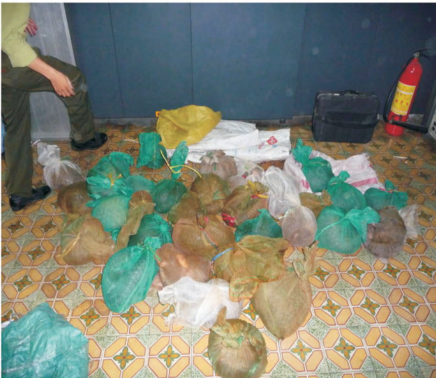
Vấn đề đặt ra là xử lý ra sao với những cá thể ĐVHD được tịch thu nhưng không thể thả về tự nhiên và cũng không được các trung tâm cứu hộ tiếp nhận vì quá tải.

Tiêu hủy nhân đạo cũng là một giải pháp khác nên được xem xét khi xử lý động vật tịch thu trong trường hợp không thể thả về tự nhiên hay chuyển giao cho các cơ sở cứu hộ. Một số người cho rằng việc tiêu hủy một con vật đang khỏe mạnh là tàn nhẫn mà không nghĩ rằng đó là cách ngăn chặn động vật hoang dã bị đưa trở lại đường dây buôn bán. Thậm chí một số khác còn cho rằng tiêu hủy động vật hoang dã là “ném tiền qua cửa sổ”.