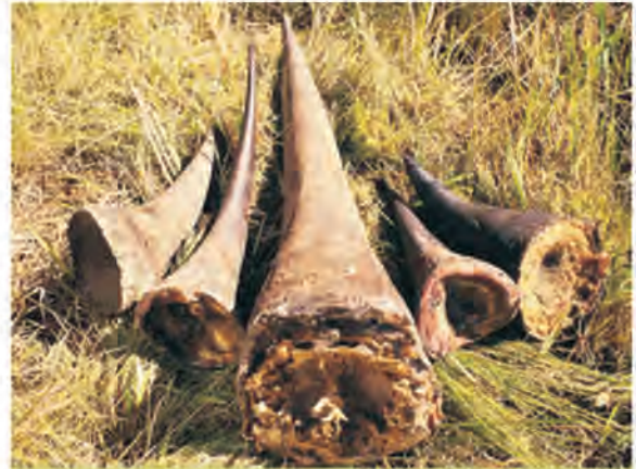
Sừng tê giác châu Phi đang được tìm cách đưa vào thị trường Việt Nam và Trung Quốc vào tháng 7/2009

Tê giác Java, tê giác Sumatra và tê giác đen là 3 loài cực kỳ nguy cấp. Tê giác Ấn Độ: nguy cấp, và tê giác trắng: ít nguy cấp.