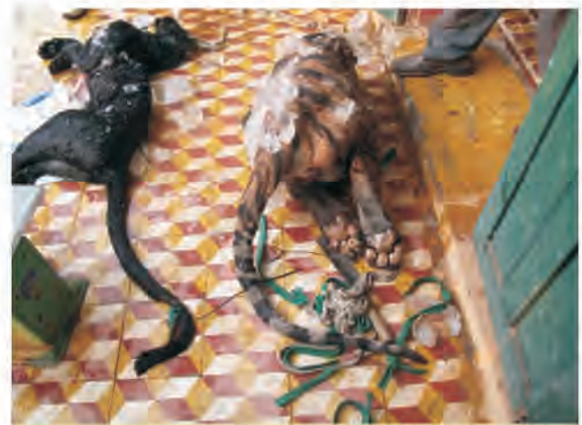
Một cá thể hổ và báo đen được đội biên phòng Quảng Trị tịch thu.

Ngày 7/3/2010, bộ đội biên phòng tỉnh Quảng Trị phối hợp với các lực lượng chức năng trên địa bàn bắt quả tang 1 vụ vận chuyển động vật hoang dã quý hiếm gồm một con hổ đông lạnh, một con báo đen và hơn 1 tấn xương và sừng động vật trên một chiếc ô tô tại cửa khẩu Lao Bảo. Lái xe khai được thuê chở số hàng trên để giao cho một người không quen biết ở Quảng Bình. Tuy nhiên, đối tượng vận chuyển là người trú tại xã Đô Thành, huyện Yên Thành, 1 trong 2 huyện nổi tiếng là trung tâm buôn lậu động vật hoang dã ở miền Trung Việt Nam. (Hồ sơ lưu trữ ENV số 2331/ENV).