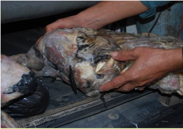
Đầu một con hổ đông lạnh bị cắt nhỏ và giấu vào cốp xe ô tô được Cảnh sát Môi trường thành phố Hà Nội và Công an quận Đống Đa bắt quả tang vào tháng 2 năm nay.

dụng xe máy vận chuyển trái phép 1 bộ xương hổ và 10kg xương sơn dương trên phố Cát Linh. Khám xét nơi ở của một đối tượng liên quan đến vụ việc xảy ra tại quận Đống Đa, cảnh sát tịch thu được nhiều sản phẩm động vật hoang dã gồm 6 bộ da hổ, túi mật gấu, 7 bộ chân tay gấu và các bộ phận cơ thể động vật hoang dã khác. Tiếp tục khám xét nơi ở của một đối tượng khác liên quan, cảnh sát cũng đã tịch thu được một bộ xương hổ và một bao xương động vật hoang dã khác. (Thông tin được lưu trong hồ sơ số 1550).