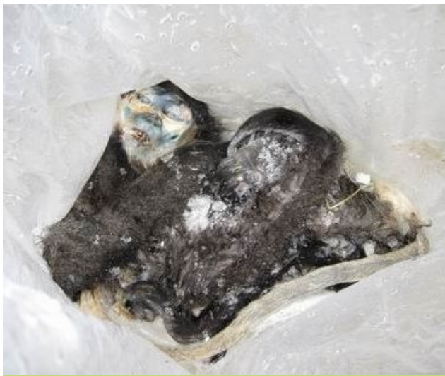
Xác của một số trong 52 xác con voọc chà vá chân đen tịch thu tại tỉnh Bắc Cạn vào tháng 7/ 2009.