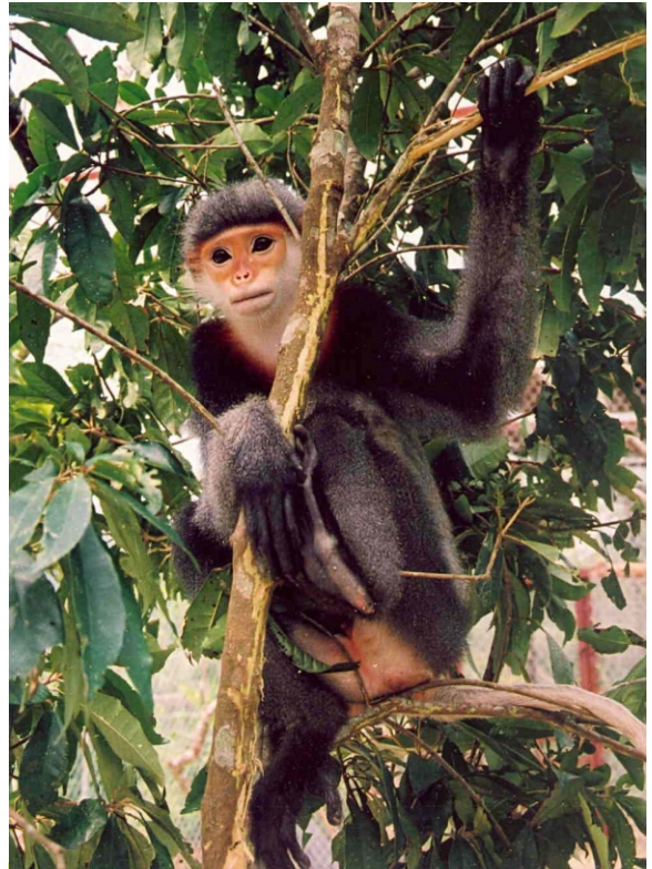
Voọc chà vá chân đen nổi bật với chân đen và mình xám.