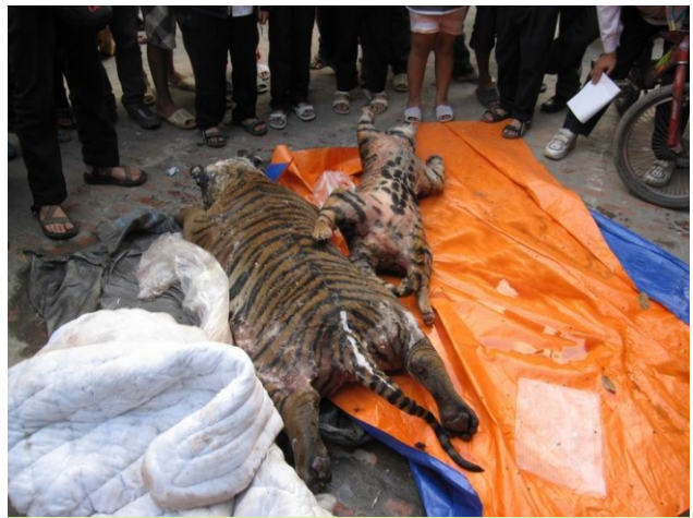
Xác hai con hổ do Cảnh sát Môi trường thành phố Hà Nội thu giữ vào tháng 10/2009.

Cuối năm nay, thời hạn được phép nuôi nhốt hổ của phần lớn các chủ trại hổ sẽ hết hạn. Nếu một số chủ trại vẫn được phép tiếp tục nuôi đàn hổ hiện tại thì cần phải nghiêm cấm việc phát triển đàn hổ nuôi cho đến khi từng trại hổ đưa ra được một kế hoạch gây nuôi hổ với những mục đích gây nuôi bảo tồn rõ ràng. Các chủ trại hiện nay đang kêu ca về chi phí tốn kém cho đàn hổ nuôi của họ. Qua đó chúng ta thấy tình hình sẽ trở nên nghiêm trọng hơn khi số hổ được sinh ra tại các trại tăng lên và áp lực yêu cầu cho phép họ buôn bán hổ - hành vi được tin rằng đã và đang diễn ra tại một số trại nuôi nhốt hổ, sẽ càng tăng.