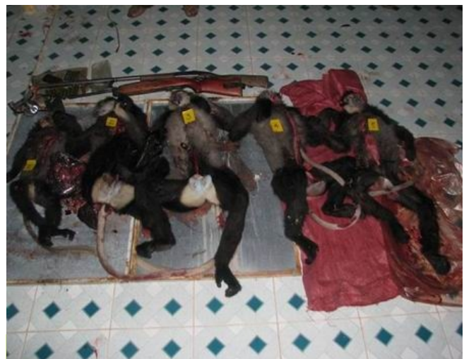
Xác 5 cá thể chà và chân đen do một đối tượng đang vận chuyển trái phép bằng xe máy ngay cạnh Khu bảo tồn Thiên nhiên Hòn Bà, tỉnh Khánh Hòa vào tháng 3/2009.

Ba đối tượng vận chuyển trái phép voọc trong tháng 3 sau đó đã bị bắt và khởi tố. Các đối tượng nhận mức án từ 24 đến 48 tháng tù giam. (Thông tin được lưu trong hồ sơ số 1563, 1625, 1798).