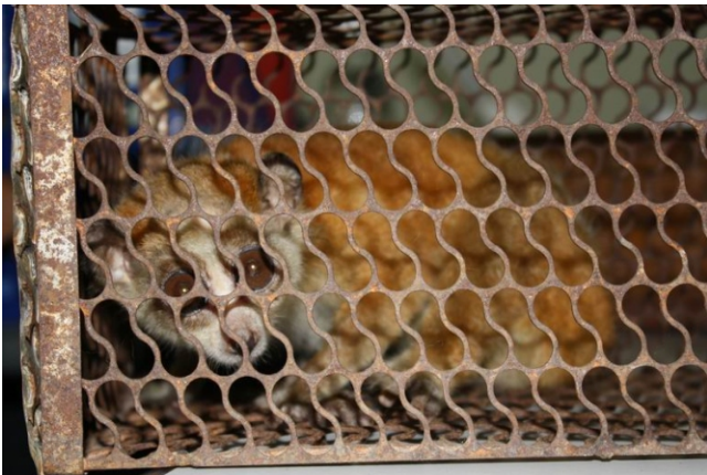
Một trong các cá thể cu li được người dân tự nguyện chuyển giao tới ENV sau đó được chuyển về Trung tâm Cứu hộ linh trưởng.

Trong tháng 6, Hạt Kiểm lâm huyện Bắc Hà, tỉnh Lào Cai đã tịch thu được 1 con cu li đang bị rao bán ở chợ Bắc Hà và 2 con cu li nuôi nhốt trái phép tại một cửa hàng trên địa bàn huyện. Cả hai vụ việc đều bắt nguồn từ nguồn tin của người dân thông báo về đường dây nóng bảo vệ ĐVHD của ENV sau đó thông tin được chuyển tới Hạt kiểm lâm huyện. (Thông tin được lưu trong hồ sơ số 1849, 1855).