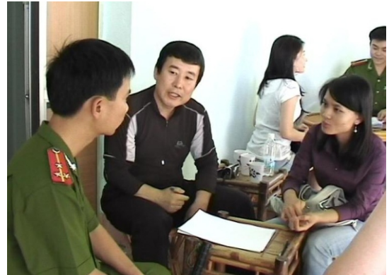
Cảnh sát thẩm vấn khách tham quan tại một trại gấu ở Quảng Ninh. Tại đây, ngày 2/10, các chiến sỹ cảnh sát đã phát hiện hành vi chích hút mật gấu và bán cho đoàn khách Hàn Quốc.

Vào ngày 02 tháng 10 vừa qua, các cán bộ Phòng Cảnh sát Môi trường, Công an tỉnh Quảng Ninh đã đột nhập một trong sáu trại gấu ở ngoại ô thành phố Hạ Long và bắt quả tang các đối tượng đang có hành vi chích hút và bán trái phép mật gấu cho khách du lịch nước ngoài. Tại trại gấu này, một đoàn du khách Hàn Quốc đang tập trung trong một căn phòng để chứng kiến cảnh chích hút mật gấu và được ông chủ trại và nhân viên người Hàn Quốc mời mua mật gấu. Lực lượng cảnh sát đã tịch thu một máy siêu âm và các thiết bị khác được sử dụng để chích hút mật và hơn 200 chai, gói đựng mật gấu tươi và mật gấu khô mà ông chủ người Hàn dự định bán cho du khách. Đoàn khách du lịch Hàn Quốc, những người có thể không nhận thức được việc mua và vận chuyển mật gấu là những hành vi vi phạm pháp luật, đã được phép tiếp tục cuộc hành trình của mình sau khi hoàn tất việc khai báo thông tin cá nhân với các cơ quan chức năng.