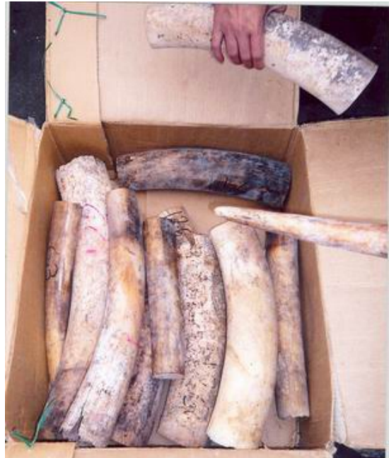
Hộp ngà voi do Hải quan Hải Phòng tịch thu hồi tháng 3/2009.

Cụ thể, vào tháng 3/2009, Hải quan Hải Phòng đã tịch thu được hơn 6 tấn ngà voi đóng trong 2 công-ten-nơ nguy trang chứa giấy vụn. Cục Hải quan Việt Nam đã cung cấp thông tin này tới các cơ quan chức năng Tanzania nhằm trợ giúp họ trong việc điều tra, bắt giữ một số đối tượng ở Tanzania bị tình nghi có liên quan đến hoạt động buôn lậu ngà voi. Vào tháng 7/2009, Cục Hải quan phát hiện thêm một vụ vận chuyển 611kg ngà voi trái phép chứa trong 1 công-ten-nơ có nguồn gốc từ Mozambique. Vào tháng 8/2009, lực lượng này cũng