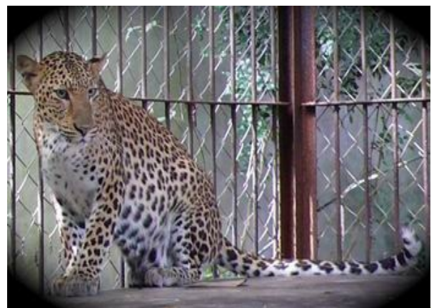
Một trường hợp hiếm có: Một người dân tự nguyện chuyển giao một con báo cho cơ quan chức năng tỉnh Vĩnh Long để chuyển về Trung tâm Cứu hộ ĐVHD Củ Chi.

Trong 9 tháng đầu năm, ENV ghi nhận được tổng cộng 14 vụ tình nguyện chuyển giao ĐVHD từ người dân tới các trung tâm cứu hộ, trong đó có một công ty tình nguyện chuyển 3 con gấu đã gắn chip tới Chi cục Kiểm lâm thành phố Hồ Chí Minh. Đầu tháng 5, một ngôi chùa cũng tình nguyện chuyển giao 26 con rùa trong đó có 6 loài bản địa tới Trung tâm Cứu hộ ĐVHD Củ Chi sau khi được các bạn sinh viên tham gia chuyển khảo sát về loài rùa tại một số chùa nâng cao nhận thức. (Thông tin được lưu trong hồ sơ số 2025, 1762).