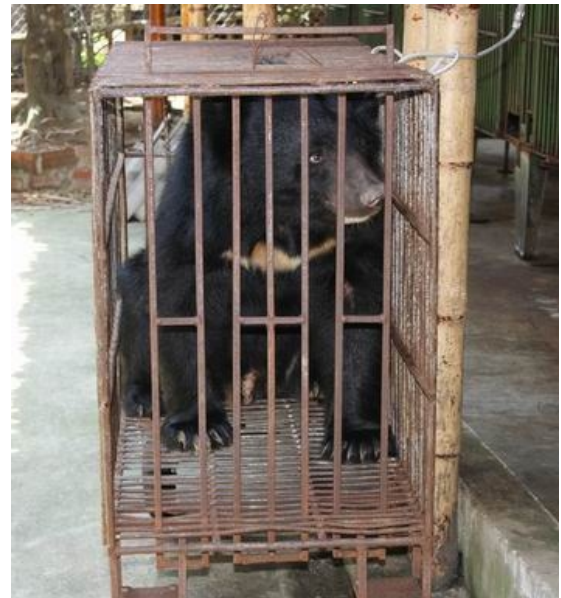
Cá thể gấu tại trại gấu Hạ Long bị nhốt để trích hút mật bất cứ khi nào khách du lịch nước ngoài đến.

Trung tâm Giáo dục Thiên nhiên (ENV) cam kết hỗ trợ và phối hợp với các cơ quan chức năng trong việc ngăn chặn nạn buôn bán trái phép gấu; chấm dứt việc nuôi nhốt gấu; khuyến khích sử dụng thuốc thay thế mật gấu cũng như đảm bảo việc trừng phạt thích đáng những chủ trại gấu vi phạm pháp luật mà điển hình là chủ các trại gấu tổ chức chích hút mật gấu trái phép để phục vụ khách du lịch ở Hạ Long. ENV cũng mong muốn những giá trị của điểm du lịch nổi tiếng Vịnh Hạ Long không bị lu mờ bởi những hoạt động kinh doanh trái phép của một số đối tượng muốn làm giàu bất chính.