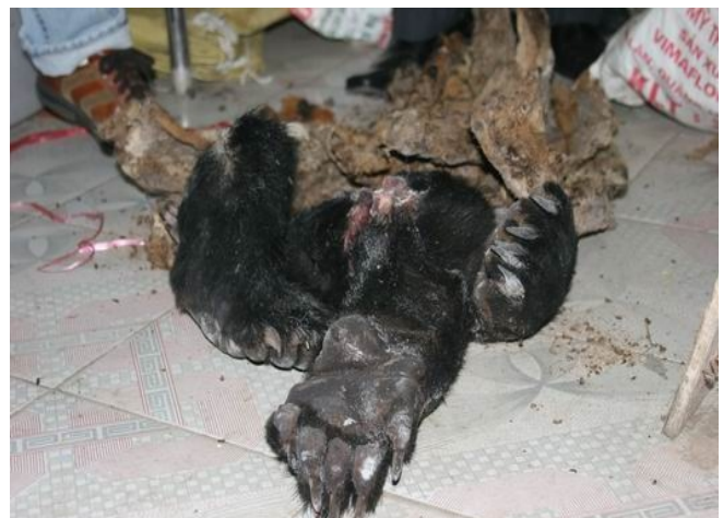
Chân gấu do Cảnh sát Môi trường tịch thu tại một điểm kinh doanh ĐVHD ở Hà Nội.

Tính từ tháng 5/2009 đến tháng 9/2009, Phòng Cảnh sát Môi trường - Công an thành phố Hà Nội phát hiện 4 vụ vận chuyển trái phép rắn hổ mang chúa, tịch thu được tổng cộng 11 con. Phần lớn các đối tượng vận chuyển rắn hổ mang đến địa bàn thành phố để tiêu thụ. Rắn hổ mang chúa được bảo vệ trong nhóm 1B của Nghị định 32/2006/NĐ-CP. Số rắn trên đã được chuyển giao về Trung tâm Cứu hộ ĐVHD Sóc Sơn. (Thông tin được lưu trong hồ sơ số 1811, 1885, 1958, 1959).