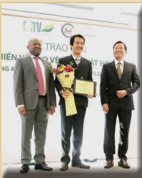
Giải Thẩm phán xuất sắc Ông Ngô Đức Thụy - Tòa án nhân dân quận Tân Bình