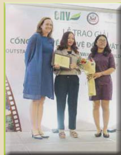
Giải Đặc biệt – Chiến công xuất sắc – Triệt phá đường dây tội phạm về ĐVHD Tòa án nhân dân tỉnh Khánh Hòa

khác đang theo chân tê giác trên chận điều đó hoàn toàn phụ thuộc mọi thứ quá muộn.”