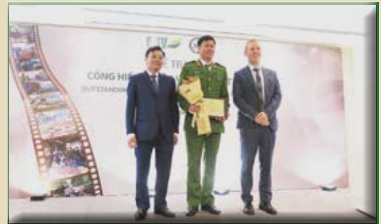
Giải Cơ quan thực thi pháp luật xuất sắc Đội 2, Phòng Cảnh sát phòng chống tội phạm về môi trường – Công an tỉnh Hà Tĩnh