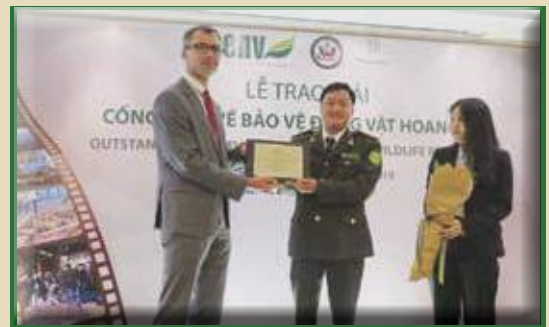
Giải Cơ quan thực thi pháp luật xuất sắc Đội Kiểm lâm cơ động Số 1 – Chi cục Kiểm lâm tỉnh Thanh Hóa