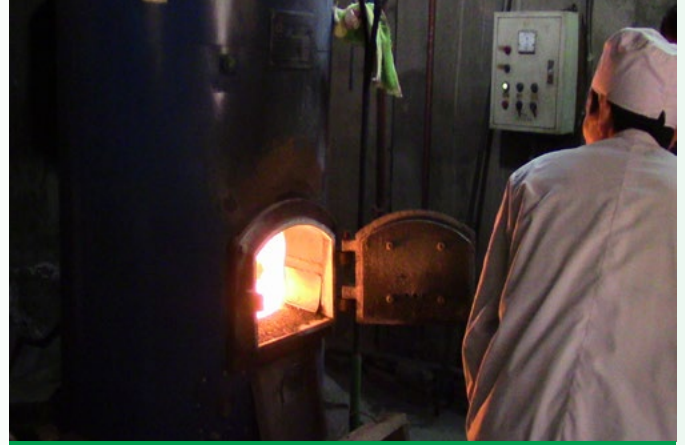
Cơ quan chức năng Thanh Hóa tiêu hủy cao hổ sau tịch thu

Ngày 12/03, ENV đã phối hợp với Hạt Kiểm lâm Bảo Lâm tiếp cận một đối tượng rao bán trên mạng một cá thể cây hương ( Viverricula indica ). Bằng nghiệp vụ điều tra, cán bộ Kiểm lâm đã tiếp cận đối tượng và bất ngờ tịch thu cá thể cây hương. Cá thể này sau đó đã được thả vào rừng địa phương (Hồ sơ lưu trữ số 8076/ENV).