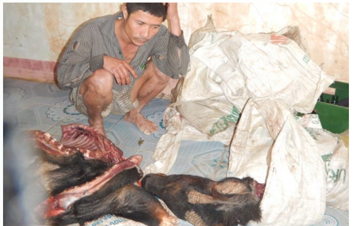
Thịt và bộ phận của Sơn dương trong vụ săn bắt trái phép ở Quảng Bình