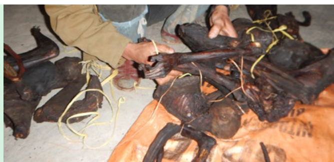
Đối tượng bị phát hiện với xác voc Hà Tĩnh sấy khô dùng để bào chế thuốc

Theo Nghị định 40/2015/NĐ-CP, các loài được liệt kê trong Danh sách loài nguy cấp, quý, hiếm được ưu tiên bảo vệ ban hành kèm theo Nghị định 160/2013/NĐ-CP không thuộc phạm vi điều chỉnh của Nghị định 157/2013/NĐ-CP. Điều này có nghĩa là các vi phạm liên quan đến bắt cứ loài ĐVHD nguy cấp, quý, hiếm được