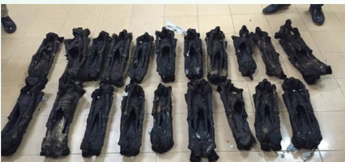
Xương 20 cá thể voọc chà vá chân đen bị phát hiện trên một xe khách tại Hà Nội

Ngày 28/01, Đội cảnh sát Giao thông, Công an TP. Hà Nội phát hiện xương 20 cá thể voọc chà vá chân đen ( Pygathrix nigripes ) trong một xe khách trên địa bàn huyện Sóc Sơn. Hiện cảnh sát đang tiến hành điều tra vụ việc để tìm ra chủ nhân của số tang vật nói trên. Buôn lậu các sản phẩm từ ĐVHD bằng xe khách là phương pháp được các đối tượng sử dụng thường