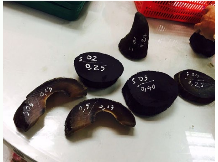
1,39 kg sừng tê giác giấu trong đầu tôm hùm bị phát hiện tại Sân bay Quốc tế Tân Sơn Nhất

xuyên bởi phương pháp này thường gây khó khăn cho cơ quan chức năng khi truy tìm chủ sở hữu của hàng hóa (Hồ sơ lưu trữ số 7952/ENV).