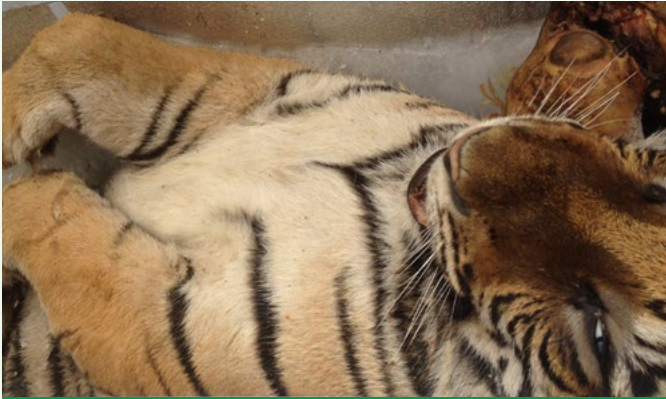
Một cá thể hổ đông lạnh bị tịch thu bởi cơ quan chức năng tại Nghệ An

Sau một thời gian theo dõi, Công an huyện Thanh Chương nắm được thông tin về việc một đối tượng đang lưu giữ một cá thể hổ đông lạnh tại nhà. Lực lượng công an đã lên kế hoạch phục kích và bắt quả tang người thân của đối tượng đang vận chuyển 02 xác hổ đông lạnh. Ngày 20/01, cơ quan chức năng tổ chức khám xét và phát hiện cá thể hổ đông lạnh tại nhà của đối tượng. Cá thể hổ được cho là có nguồn gốc từ Lào và vận chuyển đến nhà của đối tượng bằng phương tiện chuyên dụng (Hồ sơ lưu trữ số 7935/ENV).