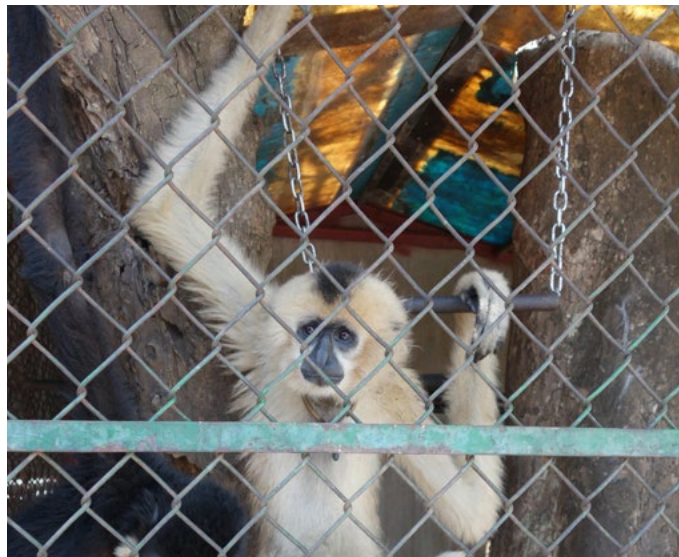
Cá thể vượn được chuyển đến Trung tâm cứu hộ Củ Chi sau thời gian dài nuôi nhốt trong một khu dân cư tại Bà Rịa – Vũng Tàu

Trong tháng 01 , sau khi nhận được thông tin qua đường dây nóng của ENV, Cục cảnh sát phòng chống tội phạm về môi trường (C49) kết hợp với công an tỉnh Bắc Kạn đã phát hiện và tịch thu một cá thể hổ đông lạnh vừa được chuyển từ Hà Nội đến một khách sạn tại Bắc Kạn để nấu cao. Cá thể hổ này nặng 303 kg và được cắt thành 05 phần. Trong khi khám xét khách sạn, cơ quan chức năng phát hiện thêm 02 túi xương động vật nặng 53 kg, 03 kg