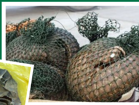
Tê tê bị vận chuyển trái phép ở Thanh Hóa