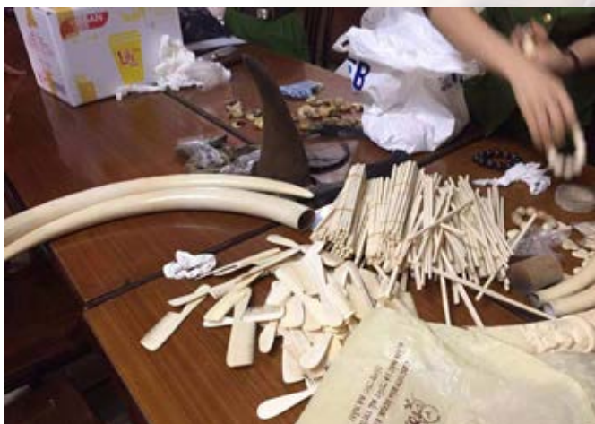
Nhiều sản phẩm được chế tác từ ngà voi bị thu giữ tại nhà của Nguyễn Mậu Chiến ở quận Hà Đông, Hà Nội. Hồ sơ vụ việc số 10872/ENV

Đã tới lúc những kẻ đầu sỏ hủy diệt đa dạng sinh học phải chịu trách nhiệm trước pháp luật vì thu lợi bất chính từ hoạt động buôn bán các loài ĐVHD nguy cấp, quý hiếm! Những đối tượng này cũng cần phải trả giá vì những hành động ảnh hưởng đến uy tín và hình ảnh của Việt Nam trên trường quốc tế.