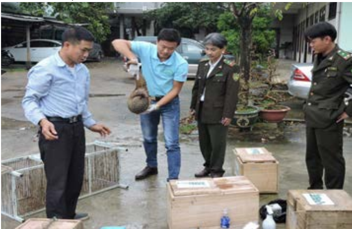
Chi cục Kiểm lâm thành phố Đà Nẵng đang kiểm tra các cá thể tê tê được phát hiện trong một kiện hành lý đặt tại sảnh của một khách sạn. Hồ sơ vụ việc số 10538/ENV

Ngày 2/1/2017, Cảnh sát phường Tân Chính phối hợp cùng Phòng 7, Cục Cảnh sát phòng, chống tội phạm về buôn lậu, Chi cục Kiểm lâm thành phố Đà Nẵng và Công an quận Thanh Khê, đã thu giữ 4 cá thể tê tê Java ( Manis javanica ) tại một khách sạn ở Đà Nẵng. Nhân viên khách sạn đã nhận thấy một kiện hành lý đặt tại sảnh có nhiều dấu hiệu khả nghi và thông báo đến cơ quan chức năng. Qua quá trình kiểm tra, các cơ quan chức năng phát hiện 4 cá thể tê tê sống. Cơ quan chức năng xác định một đối tượng đã được thuê để vận chuyển các cá thể tê tê bằng xe khách từ Đà Nẵng tới Kon Tum. Đối tượng sau đó đã bị bắt giữ khi tới khách sạn để lấy hành lý. Các cá thể tê tê được chuyển đến Chương trình Bảo tồn Thú ăn thịt và Tê tê tại Vườn quốc gia Cúc Phương. (Hồ sơ vụ việc số 10538/ENV)