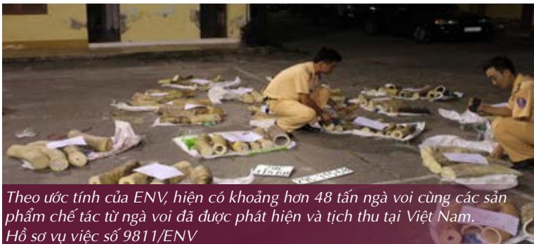
Theo ước tính của ENV, hiện có khoảng hơn 48 tấn ngà voi cùng các sản phẩm chế tác từ ngà voi đã được phát hiện và tịch thu tại Việt Nam. Hồ sơ vụ việc số 9811/ENV

Năm 2016, có ít nhất 4 vụ án liên quan đến buôn bán ngà voi được đưa ra xét xử và có áp dụng hình phạt tù giam cho các đối tượng liên quan. Một đối tượng buôn bán 1,5 kg ngà voi và 32,5 kg các sản phẩm chế tác từ ngà voi đã bị Tòa án nhân dân huyện Thường Tín (Hà Nội) tuyên phạt 15 tháng tù giam (Hồ sơ vụ việc số 10139/ENV). Tương tự, một đối tượng khác cũng phải nhận mức án 15 tháng tù giam cho hành vi buôn bán 12,5 kg ngà voi (Hồ sơ vụ việc số 9938/ENV). Tại Bắc Giang, Tòa án nhân dân huyện Lạng Giang đã tuyên phạt 10 tháng tù giam đối với một đối tượng buôn bán 0,5 tấn ngà voi (Hồ sơ vụ việc số 9811/ENV). Một đối tượng khác tại Quảng Nam cũng đã phải nhận mức án 5 tháng tù giam sau khi bị bắt quả tang vận chuyển 112,3 kg ngà voi (Hồ sơ vụ việc số 8477/ENV).