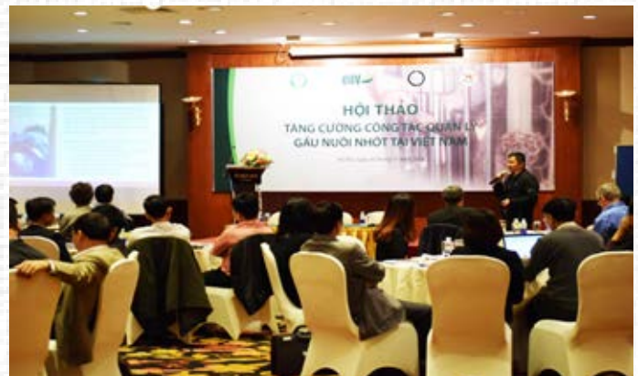
Cuối năm 2016, đại diện chi cục kiểm lâm một số tỉnh thành còn nhiều gấu nuôi nhốt đã họp tại Hà Nội để cùng đóng góp ý kiến, xây dựng chiến lược nhằm thúc đẩy tiến trình chấm dứt tình trạng nuôi nhốt gấu tại Việt Nam.

Lãnh đạo các tỉnh, thành phố và các cơ quan hữu quan đóng vai trò then chốt trong nỗ lực xóa bỏ tình trạng nuôi nhốt gấu tại địa phương, bằng cách khuyến khích các chủ cơ sở tự nguyện chuyển giao gấu cho cơ quan chức năng (không hỗ trợ tài chính) và tịch thu cá thể gấu tại các cơ sở có hành vi vi phạm (trích hút mật gấu hay không đáp ứng đủ điều kiện nuôi nhốt gấu). Theo pháp luật hiện hành, tất cả các cá thể gấu không có đăng ký gắn chip đều có nguồn gốc bất hợp pháp và cần được tịch thu.