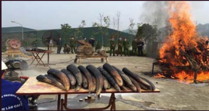
Lào Cai đã chủ động tiêu hủy ngà voi tịch thu được từ một vụ vi phạm. Quyết định này rất đáng được hoan nghênh và hy vọng nhiều địa phương khác sẽ noi theo. Hồ sơ vụ việc số 8782/ENV

Cuối năm 2016, sự kiện tiêu hủy ngà voi và sừng tê giác tại Hà Nội đã thể hiện một bước tiến mới của Việt Nam trong công tác xử lý tang vật là ngà voi và sừng tê giác. Không lâu sau đó, các cơ quan chức năng tỉnh Lào Cai đã tổ chức tiêu hủy 43 khúc ngà voi tịch thu từ một vụ vận chuyển trái phép vào tháng 8/2015 (Hồ sơ vụ việc số 8782/ENV). Mặc dù khối lượng ngà voi tiêu hủy tại Lào Cai rất nhỏ so với khoảng 46 tấn ngà voi hiện đang còn lưu trữ trên cả nước, sự kiện này có ý nghĩa rất lớn, thể hiện tinh thần chủ động và sự quyết tâm của các cơ quan chức năng tỉnh Lào Cai trong nỗ lực bảo vệ ĐVHD.