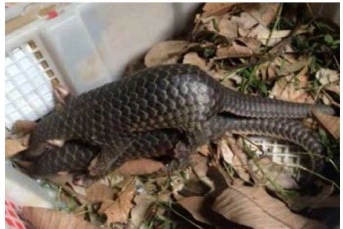
Tại Việt Nam, vảy tê tê được sử dụng phổ biến làm thuốc còn thịt tê tê cũng là một đặc sản trong nhà hàng. Tuy nhiên, phần lớn tê tê sống và vảy tê tê thường bị buôn lậu sang Trung Quốc. Hồ sơ vụ việc số 10659/ENV

Cũng trong ngày 3/3/2017, Chi cục Hải quan Sân bay quốc tế Nội Bài đã mở một kiện hàng từ Cameroon tới Việt Nam và tịch thu 25 thùng các-tông đựng vảy tê tê với tổng khối lượng 387,5 kg. Lô hàng này được chuyển tới từ Yaoundé vào tháng 8/2015 nhưng không có người nhận cho tới khi được kiểm tra. (Hồ sơ vụ việc số 10687/ENV)