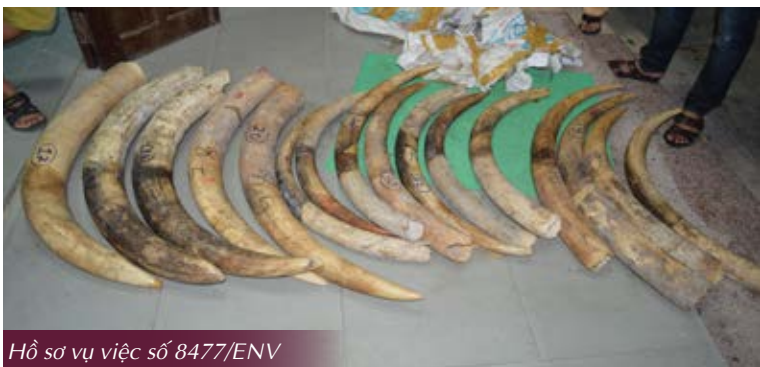
Hồ sơ vụ việc số 8477/ENV