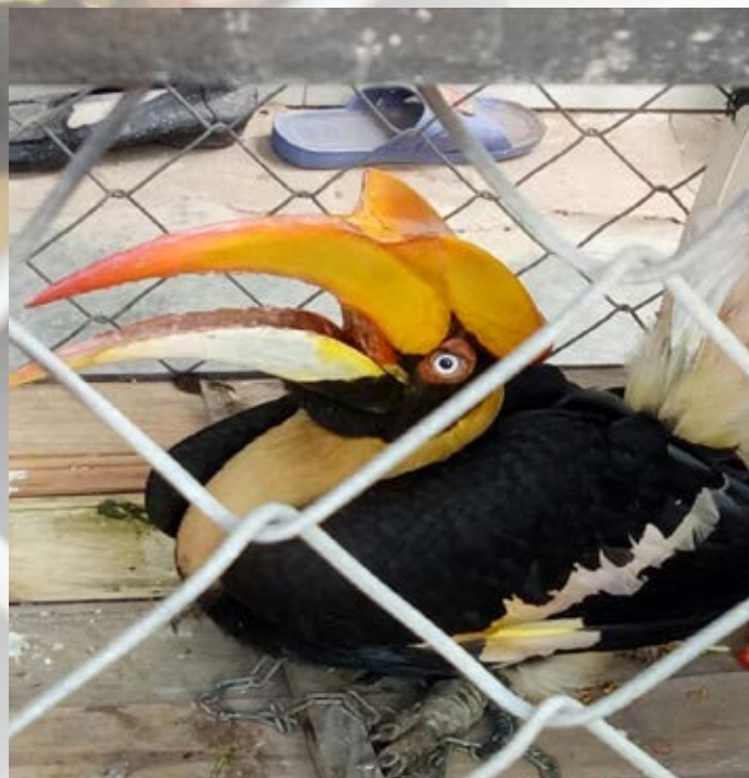
Hồ sơ vụ việc số 10673/ENV

Ngày 4/3/2017, theo tin báo qua Đường dây nóng về bảo vệ ĐVHD của ENV, Phòng CSMT – Công an tỉnh Lâm Đồng phối hợp cùng ENV đã tịch thu một cá thể chim hồng hoàng ( Buceros bicornis ). Cá thể hồng hoàng này được quảng cáo trên Facebook với giá 18 triệu đồng. (Hồ sơ vụ việc số 10673/ENV)