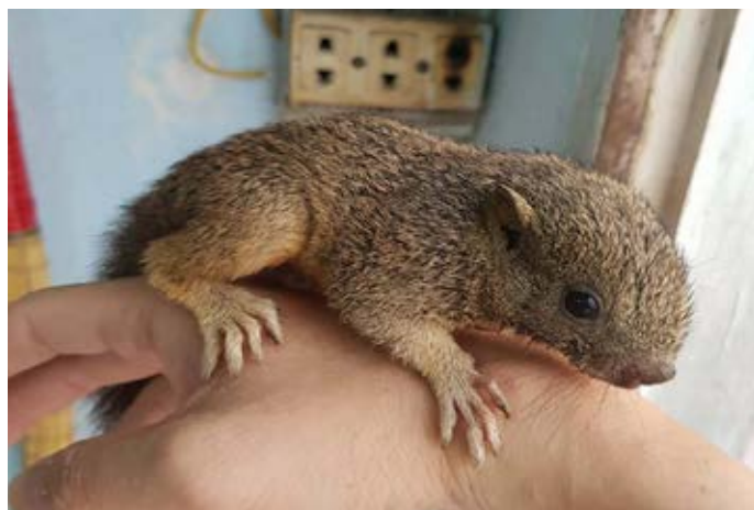
Một cá thể sóc bị rao bán trên Facebook. Sóc cũng là loài ĐVHD thường bị buôn bán trái phép làm thú cảnh. Hồ sơ vụ việc số 10825/ENV

Ngày 16/4/2017, lực lượng cảnh sát giao thông tỉnh Lạng Sơn thu giữ 11 cá thể sóc chết, 17 cá thể cây và 3 cá thể cây vòi hương sống ( Paradoxurus hermaphroditus ) sau khi phát hiện một đối tượng vận chuyển trái phép ĐVHD bằng xe máy từ Lạng Sơn tới Bắc Giang. Đối tượng này sau đó bị xử phạt 6 triệu đồng. Các cá thể ĐVHD chết bị đã tiêu hủy. (Hồ sơ vụ việc số 10845/ENV)