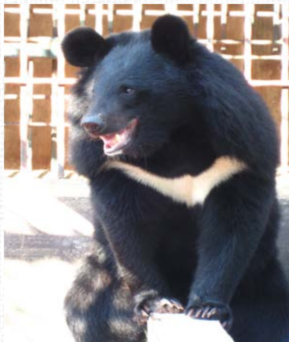
Một cá thể gấu may mắn được chuyển giao đến Trung tâm cứu hộ. Tịch thu các cá thể gấu không có đăng ký và khuyến khích chủ nuôi gấu tự nguyện chuyển giao gấu cho nhà nước là một phần của chiến lược nhằm chấm dứt tình trạng nuôi nhốt gấu tại Việt Nam được bắt đầu từ năm 2005.

Ngoài ra, một số tổ chức khác như Tổ chức Động vật Châu Á (AAF) và Free the Bears cũng có nhiều đóng góp trong nỗ lực chung nhằm chấm dứt tình trạng nuôi nhốt gấu lấy mật tại Việt Nam.