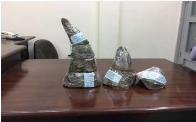
Hồ sơ vụ việc số 10820/ENV

Ngày 14/4/2017, cơ quan chức năng đã tịch thu 4,8 kg sừng tê giác châu Phi ( Diceros bicornis ) từ hai hành khách người Việt Nam đáp xuống sân bay Tân Sơn Nhất từ Luanda, Angola và quá cảnh tại Dubai. Tang vật là 3 chiếc sừng tê giác đã được cắt làm 7 khúc, bọc giấy thiếc và giấu trong thùng các-tông bên trong hành lý ký gửi. (Hồ sơ vụ việc số 10820/ENV)