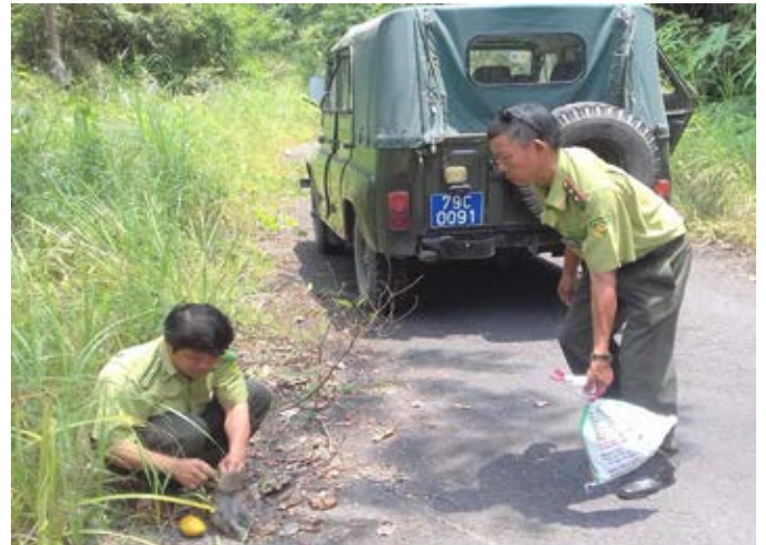
Một cá thể khỉ được lực lượng kiểm lâm thả về tự nhiên. Các cá thể ĐVHD tịch thu được, dù là loài nguy cấp hay thông thường, cần được tái thả về tự nhiên hoặc chuyển giao tới các trung tâm cứu hộ thay vì bán đấu giá. Hồ sơ vụ việc số 10833/ENV

Ngày 29/3/2017, theo tin báo từ người dân tới Đường dây nóng về bảo vệ ĐVHD của ENV, Phòng CSMT – Công an tỉnh Vĩnh Long đã tịch thu 3 cá thể rái cá từ một đối tượng quảng cáo bán rái cá và hồng hoàng trên Internet. Ba cá thể rái cá đã được thả về một con sông gần đó. ( Hồ sơ vụ việc số 10659/ENV )