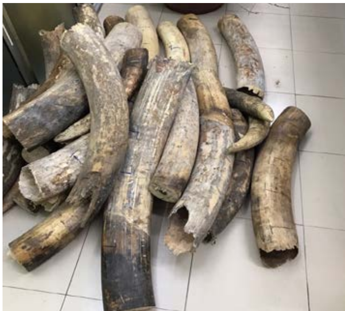
Hồ sơ vụ việc số 10596/ENV

Ngày 25/1/2017, cơ quan chức năng đã bắt giữ 423 kg ngà voi trên 2 xe ô tô khi 2 phương tiện này di chuyển qua trạm thu phí Thường Tín, Hà Nội. Số ngà voi bị tình nghi đang trên đường vận chuyển từ Thái Bình tới làng Nhị Khê (điểm nóng về buôn bán ngà voi). Ba đối tượng đã bị bắt giữ, tất cả đều cư trú tại Thường Tín (Hà Nội), một trong số đó bị tình nghi là đối tượng buôn bán ngà voi quy mô lớn. Cả 3 đối tượng đã bị khởi tố. (Hồ sơ vụ việc số 10596/ENV)