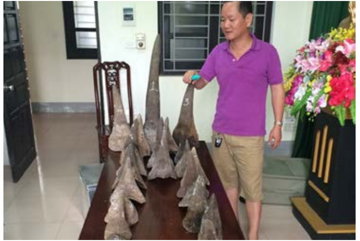
Hai đối tượng phạm tội chỉ phải chịu mức án tù treo sau khi bị phát hiện vận chuyển trái phép 31 chiếc sừng tê giác tại Nghệ An vào tháng 5/2015. Một trong hai đối tượng được cho là có liên quan trực tiếp tới một đường dây buôn bán sừng tê giác về Việt Nam. Hồ sơ vụ việc số 8380/ENV