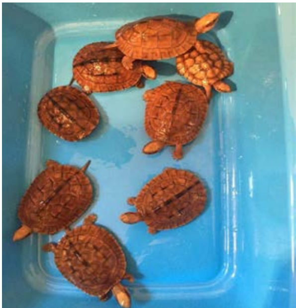
Một đối tượng ở TP. Hồ Chí Minh đã rao bán nhiều loài rùa trên internet, trong đó có cả rùa hộp ba vạch ( Cuora trifasciata ) con. Quá trình điều tra vụ việc này gặp nhiều khó khăn nhưng cuối cùng danh tính của đối tượng vì phạm đã được xác định và vụ việc đang được các cơ quan chức năng thành phố Hồ Chí Minh xử lý. (Hồ sơ vụ việc số 10880/ENV)

Ngày 8/1/2017, sau khi nhận được tin báo, Công an huyện Hương Sơn đã kiểm tra một chiếc xe khách đường dài từ Lào về Nghệ An và tịch thu 9 cá thể tê tê Java ( Manis javanica ), một cá thể rùa núi vàng ( Indotestudo elongata ), 4 cá thể rùa đất Sê-pôn ( Cyclemys tcheponensis ) với tổng khối lượng là 28 kg. Các cá thể tê tê được chuyển tới Chương trình Bảo tồn Thú ăn thịt và Tê tê, các cá thể rùa được chuyển tới Trung tâm Bảo tồn rùa tại Vườn quốc gia Cúc Phương. Tài xế và phụ xe khai báo đã được thuê vận chuyển số ĐVHD nói trên. Cả hai đối tượng đều đã bị khởi tố. (Hồ sơ vụ việc số 10555/ENV)