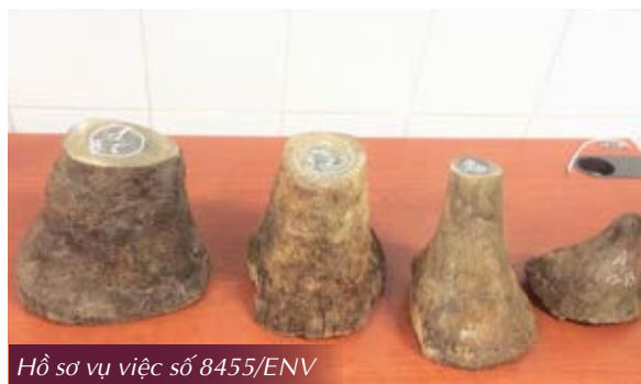
Hồ sơ vụ việc số 8455/ENV