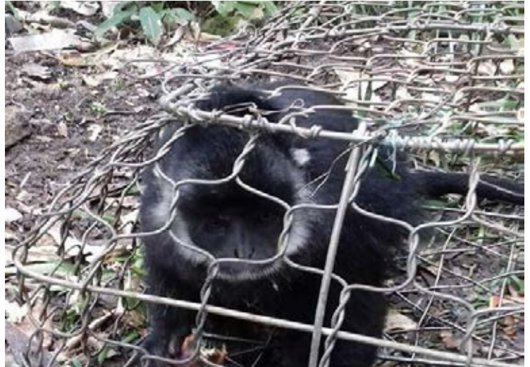
Hồ sơ vụ việc số 10637/ENV

Ngày 17/2/2017, Hạt Kiểm lâm thành phố Đồng Hới đã chuyển giao một cá thể voọc Hà Tĩnh ( Trachypithecus hatinhensis ) tới Vườn Quốc gia Phong Nha – Kẻ Bàng. Cá thể voọc này đã bị bắt trong một khu rừng tại địa phương vài ngày trước đó và được bán với giá 2 triệu đồng. Một người dân đã mua cá thể voọc này và chuyển giao cho cơ quan kiểm lâm. (Hồ sơ vụ việc số 10637/ENV)