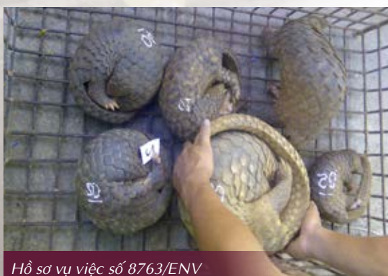
Hồ sơ vụ việc số 8763/ENV

Tương tự, một đối tượng bị bắt giữ khi đang vận chuyển 13 cá thể tê tê tại Hà Nội và một đối tượng bị bắt giữ với 11 cá thể tê tê tại Nghệ An đều phải nhận mức án 9 tháng tù giam. Tại Hải Phòng, bốn đối tượng vận chuyển trái phép 52 cá thể tê tê cũng đã phải nhận mức án từ 7-12 tháng tù giam. (Hồ sơ vụ việc số 8206, 8763, 8204/ENV)