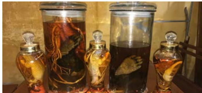
Trong vụ bắt giữ đối tượng buôn bán ĐVHD tại Hà Tĩnh, các cơ quan chức năng đã phát hiện và tịch thu thêm các bình rượu ngâm chân tay gấu. (Hồ sơ vụ việc số 8467/ENV)

Ngày 15/2/2017, bằng các biện pháp nghiệp vụ, Công an thị xã Hồng Lĩnh, phối hợp cùng ENV, đã bắt giữ một đối tượng buôn bán ĐVHD tại Hà Tĩnh với tang vật là 2 bình rượu tê tê. Qua khám xét nhà đối tượng, các cơ quan chức năng phát hiện thêm 15 sản phẩm chế tác từ ngà voi, 1 súng trường, 9 thanh kiếm, 1 con dao rựa, thuốc phiện, cần sa, 9 tay gấu và 6 bình rượu ĐVHD (tê tê, tay gấu và kỳ đà). Đối tượng này là thành viên của “Hội anh em ba miền”, một nhóm các đối tượng chuyên buôn bán ĐVHD. Đối tượng đã bị xử phạt 15 tháng tù giam. (Hồ sơ vụ việc số 8467/ENV)