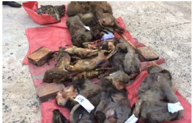
Trong số các tang vật đã được các cơ quan chức năng tịch thu có bốn cá thể voọc chà vá chân xám. Voọc chà vá chân xám là loài rất nguy cấp và chỉ phân bố tại miền Trung Việt Nam. Hồ sơ vụ việc số 10617/ENV

Ngày 7/2/2017, Phòng Cảnh sát phòng, chống tội phạm về môi trường (CSMT) – Công an tỉnh Gia Lai và Công an huyện Mang Yang đã tịch thu 72,5 kg ĐVHD, bao gồm 4 cá thể voọc chà vá chân xám ( Pygathrix cinerea ), 2 cá thể mèo rừng ( Prionailurus bengalensis ), 5 cá thể khỉ và 7 cá thể sóc từ một đối tượng buôn bán ĐVHD. Số ĐVHD được lưu giữ trong tủ đông tại một cửa hàng tạp hóa của đối tượng. Qua nhận định ban đầu, đối tượng đã mua ĐVHD từ những người dân tộc. Vụ việc đang trong quá trình điều tra. (Hồ sơ vụ việc số 10617/ENV)