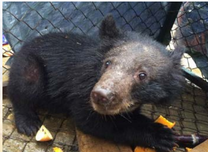
Hồ sơ vụ việc số 10584/ENV

từ một khu rừng tại địa phương. Lực lượng công an đã tịch thu cá thể gấu trong cùng ngày và chuyển giao tới Trung tâm cứu hộ, bảo tồn và phát triển sinh vật Hoàng Liên. (Hồ sơ vụ việc số 10584/ENV)