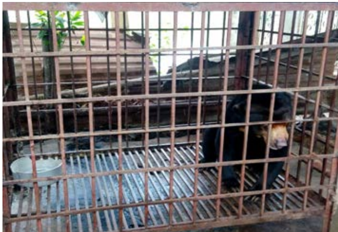
Hồ sơ vụ việc số 10633/ENV

Ngày 14/2/2017, Trung tâm cứu hộ ĐVHD Hà Nội đã tiếp nhận một cá thể gấu chó ( Helarctos malayanus ) từ một cơ sở huấn luyện chó nghiệp vụ tại huyện Ba Vì. Cá thể gấu này đã bị bắt trong rừng từ nhiều năm trước. Chi cục Kiểm lâm Hà Nội đã thu giữ cá thể gấu trên và chuyển giao tới Trung tâm cứu hộ ĐVHD Hà Nội. (Hồ sơ vụ việc số 10633/ENV)