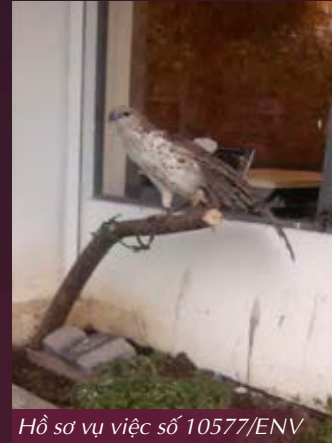
Hồ sơ vụ việc số 10577/ENV

Trong một vụ việc tương tự, ENV nhận được tin báo từ người dân và chuyển giao đến cơ quan chức năng địa phương về việc một cá thể chim săn mồi bị nuôi nhốt tại một nhà hàng trên địa bàn một tỉnh phía Bắc. Cơ quan chức năng sau đó đã kiểm tra, phát hiện cá thể chim săn mồi tại nhà hàng nhưng không tịch thu mà thậm chí còn cho phép chủ nhà hàng tiếp tục nuôi nhốt cá thể này. Biện pháp xử lý như trên không đúng theo quy định hiện hành của pháp luật. Việc cho phép chủ nhà hàng tiếp tục lưu giữ một cá thể chim không có nguồn gốc hợp pháp cũng khiến nhiều khách hàng hiểu rằng: việc nuôi nhốt chim săn mồi không cần giấy phép. Chính vì vậy, một quyết định tương chừng “vô hại” của cơ quan chức năng có thể vô tình làm gia tăng tình trạng mua bán và nuôi nhốt ĐVHD trái phép. Không những vậy, sự tin tưởng của người dân vào năng lực và trách nhiệm của các cơ quan chức năng địa phương cũng bị ảnh hưởng. Việc để tồn tại một trường hợp vi phạm pháp luật công khai mà đối tượng vi phạm không phải chịu trách nhiệm pháp lý như trên cũng gây ảnh hưởng đến mục tiêu củng cố pháp quyền của Nhà nước (Hồ sơ vụ việc số 10577/ENV).