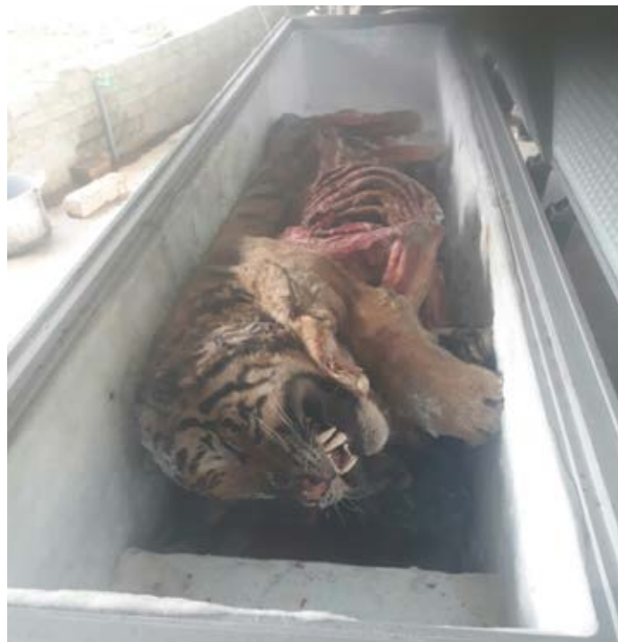
Hồ sơ vụ việc số 10722/ENV

Ngày 20/3/2017, qua quá trình theo dõi một đối tượng buôn bán hổ, Cục Cảnh sát phòng, chống tội phạm về buôn lậu (C74) và Công an huyện Diễn Châu đã kiểm tra một nhà dân, phát hiện và tịch thu 5 cá thể hổ đông lạnh. Chủ nhà không có mặt tại thời điểm tịch thu và bị nghi đã vượt biên sang Lào. (Hồ sơ vụ việc số 10722/ENV)