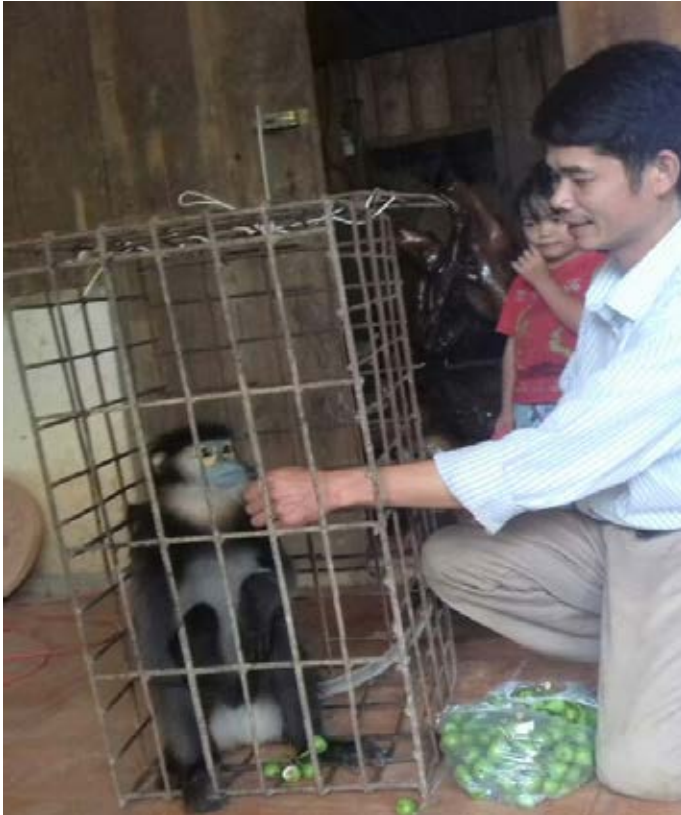
Một cá thể vẹt chà vá chân đen ( Pygathrix nigripes ) đã được chuyển giao đến cơ quan kiểm lâm địa bàn. Người dân cho biết đã mua lại cá thể này từ thợ săn và ngay lập tức thông báo chuyển giao. Mặc dù đây là một hành động đẹp, việc mua ĐVHD hoặc các sản phẩm từ ĐVHD vô tình kích thích săn bắt và tiêu thụ, đẩy nhiều cá thể ĐVHD khỏi môi trường sống tự nhiên của chúng. Cộng đồng cần được khuyến khích thông báo vi phạm về ĐVHD tới các cơ quan chức năng ngay khi phát hiện vi phạm. Hồ sơ vụ việc số 10938/ENV

Ngày 28/3/2017, Công an huyện Tân Biên đã tịch thu một cá thể rắn hổ mang chúa ( Ophiophagus hannah ) đã chết và nhiều cá thể vẹt trong một chiếc xe ô tô 12 chỗ. Lái xe cho biết đã mua những cá thể ĐVHD này tại Cam-puchia để bán ở Việt Nam. Các cá thể vẹt sau đó đã được thả về Vườn quốc gia Lò Gò – Xa Mát còn cá thể rắn chết đã bị tiêu hủy ( Hồ sơ vụ việc số 10773/ENV )