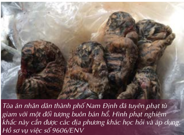
Tòa án nhân dân thành phố Nam Định đã tuyên phạt tù giam với một đối tượng buôn bán hổ. Hình phạt nghiêm khắc này cần được các địa phương khác học hỏi và áp dụng. Hồ sơ vụ việc số 9606/ENV

Năm 2016, một đối tượng buôn bán hổ tại Nam Định đã phải nhận mức án 42 tháng tù giam sau khi bị bắt giữ với tang vật là 4 cá thể hổ con đông lạnh. (Hồ sơ vụ việc số 9606/ENV)