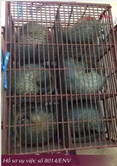
Hồ sơ vụ việc số 8014/ENV

Dưới đây là những ví dụ điển hình đáng được ghi nhận, thể hiện sự nghiêm minh của các cơ quan tư pháp trong công tác xử lý tội phạm về ĐVHD tại Việt Nam. Những ví dụ này cũng chứng tỏ nhiều cơ quan tư pháp đã hiểu rõ tác dụng của các hình phạt nghiêm khắc trong nỗ lực chung nhằm giảm thiểu và ngăn ngừa tội phạm về ĐVHD.