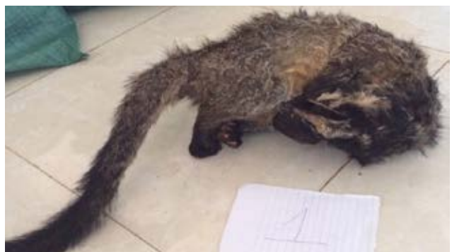
Hồ sơ vụ việc số 10615/ENV

Ngày 8/2/2017, theo tin báo qua Đường dây nóng về bảo vệ ĐVHD của ENV, Phòng CSMT – Công an tỉnh Gia Lai đã phát hiện và tịch thu 3 cá thể cầy vòi mốc ( Paguma larvata ) và một cá thể cầy vòi hương ( Paradoxurus hermaphroditus ) tại nhà một đối tượng. Đối tượng khai nhận mua 4 cá thể cầy đông lạnh làm quà tặng cho người thân và bạn bè. Đối tượng bị xử phạt vi phạm hành chính 3 triệu đồng, các cá thể cầy bị tiêu hủy. (Hồ sơ vụ việc số 10615/ENV)