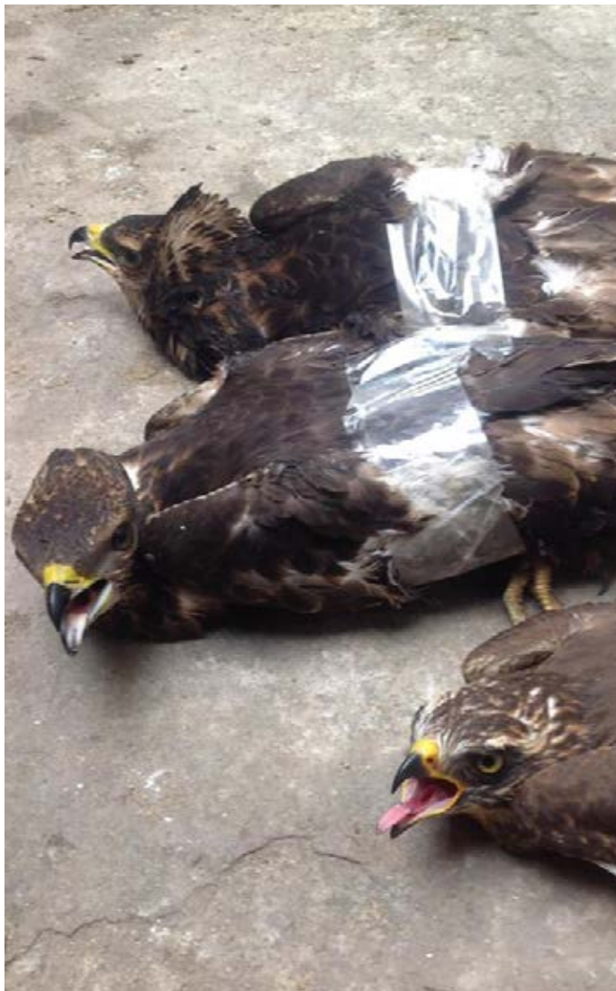
Tình trạng buôn bán chim săn mồi để làm cảnh và huấn luyện đường như đang ngày một gia tăng tại Việt Nam. Trong năm 2016, ENV đã ghi nhận nhiều vụ buôn bán chim săn mồi qua Internet. Đây hầu hết là các trường hợp vi phạm pháp luật vì chủ sở hữu không có giấy tờ chứng minh nguồn gốc hợp pháp. Hồ sơ vụ việc số 10510/ENV

Ngày 11/4/2017, theo tin báo từ người dân tới Đường dây nóng về bảo vệ ĐVHD của ENV, Chi cục Kiểm lâm tỉnh Gia Lai đã tiếp nhận hai cá thể gấu ngựa ( Ursus thibetanus ) từ một chủ nuôi tại thị xã An Khê. Tháng 11/2015, người này đã mua trái phép hai cá thể gấu từ Cam-pu-chia với giá 5.000 đô-la Mỹ mỗi cá thể. Tuy nhiên, vì việc nuôi nhốt gấu quá tốn kém, chủ nuôi đã liên hệ với ENV để được hỗ trợ chuyển giao gấu cho nhà nước. Các cá thể gấu đã được chuyển giao tới Trung tâm cứu hộ gấu Việt Nam tại Vườn quốc gia Tam Đảo. (Hồ sơ vụ việc số 10519/ENV)