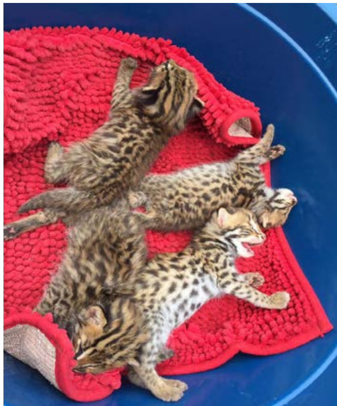
Mèo rừng thường bị buôn bán trái phép để làm thú cảnh. Tương tự như tình trạng buôn bán và nuôi nhốt khỉ, cần chú trọng khuyến khích cộng đồng không nên mua bán các loài ĐVHD để làm cảnh. Hồ sơ vụ việc số 10865/ENV

Ngày 25/4/2017, theo tin báo từ người dân tới Đường dây nóng về bảo vệ ĐVHD của ENV, Hạt Kiểm lâm huyện Xín Mần đã tịch thu một cá thể mèo rừng con ( Prionailurus bengalensis ) từ một hộ gia đình trên địa bàn tỉnh. Gia đình cho biết đã bắt cá thể mèo rừng con khi cá thể mèo mẹ săn gà của gia đình này. Sau khi bị tịch thu, cá thể mèo rừng con đã chết và được tiêu hủy. (Hồ sơ vụ việc số 10855/ENV)