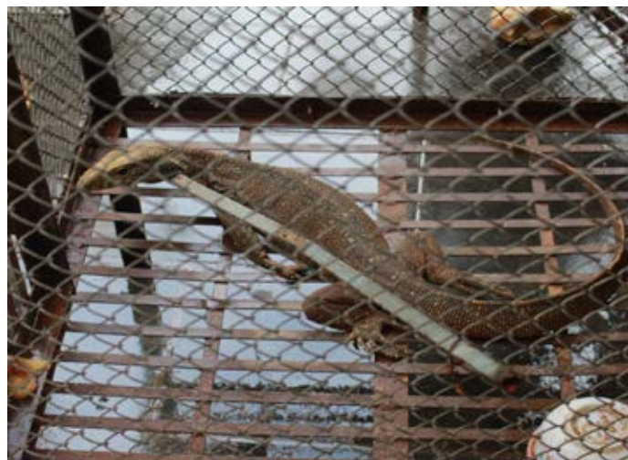
Cá thể kỳ đà bị nuôi nhốt tại một nhà thờ. Bên cạnh kỳ đà, nhiều loài ĐVHD nguy cấp, quý hiếm như vượn thường bị nuôi nhốt trái phép tại các nhà thờ, chủ yếu ở khu vực phía nam. Hồ sơ vụ việc số 10610/ENV

Lưu ý: Vụ việc này là một ví dụ điển hình để các địa phương khác noi theo. Số tiền phạt 40 triệu đồng bên cạnh việc tịch thu ĐVHD là chế tài hiệu quả ngăn ngừa vi phạm. Cơ quan chức năng cũng cần tiếp tục theo dõi và kiểm tra nhà hàng này để đảm bảo nhà hàng không tiếp tục kinh doanh ĐVHD trái pháp luật.