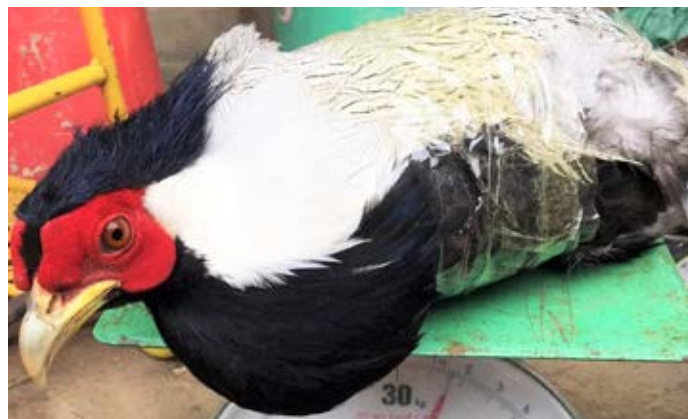
Một đối tượng chuyên buôn bán chim tại miền Bắc đã rao bán một cá thể gà lôi trắng qua Facebook. Trước sự gia tăng đáng kể của tình trạng buôn bán ĐVHD trên Internet, các cơ quan chức năng cần có các biện pháp hiệu quả hơn để xử lý triệt để tình trạng này. (Hồ sơ vụ việc số 10583/ENV)

Ngày 31/4/2017, Phòng CSMT – Công an tỉnh Hà Tĩnh đã kiểm tra một cửa hàng tạp hóa tại thành phố Hà Tĩnh, tịch thu 1 cá thể khỉ mặt đỏ ( Macaca arctoides ) và một cá thể khỉ đuôi lợn ( Macaca leonina ) với tổng khối lượng 50 kg. Các cá thể khỉ đã được thả về rừng phòng hộ. (Hồ sơ vụ việc số 10847/ENV)